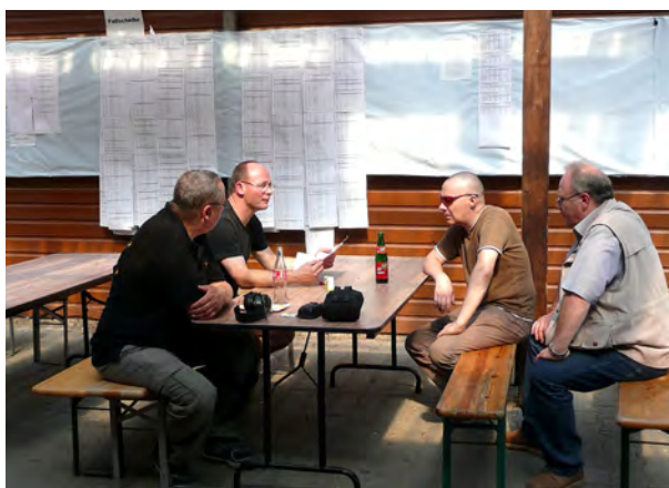
Deutsche Meisterschaft in Philippsburg Das lange (und Bange) Warten auf die aktualisierten Ergebnislisten.