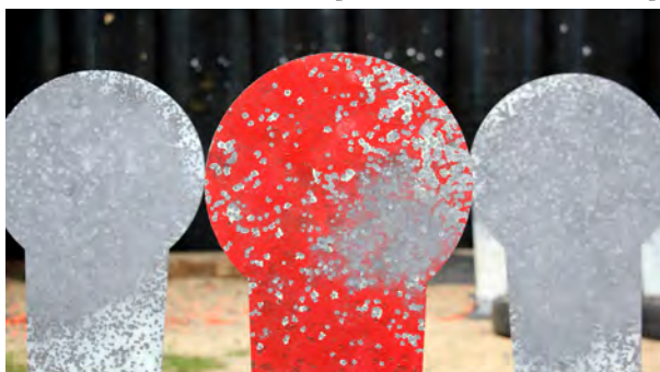
Eigentlich darf man den Roten nicht treffen

Die folgenden Bilder verdeutlichen einmal mehr wie entscheidend die Wahl der richtigen Munition sein kann. Geschossen wurde mit einer Kleinkaliberpistole auf 25m Entfernung auf die BDS Präzisionsscheibe (selbe Waffe, andere Munition).