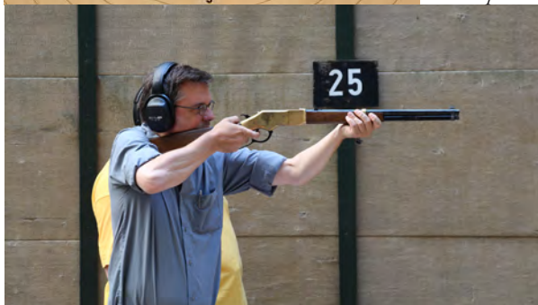
unten: mit dem Unter- hebelrepetierer

Interessant wird es dann beim Fallscheibenschießen. Hier sind 5 Fallscheiben, die sich nebeneinander auf einer