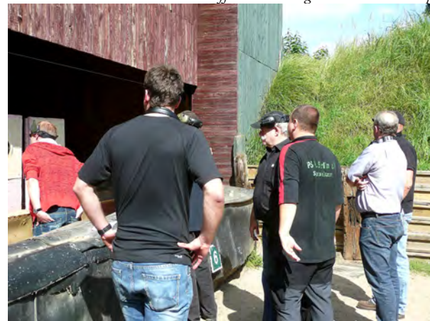
Trefferauswertung beim Nordlandcup